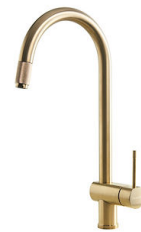
VOLTA GOLD 8491 109