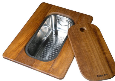
Planche de découpe Twin en bois Iroko avec tamis en acier inoxydable 8644 044