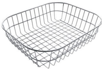
Panier en acier inoxydable 8611 000

* uniquement en combinaison avec l'accessoire 8644 101