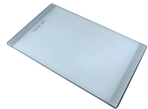
Planche de découpe en verre 8631 300