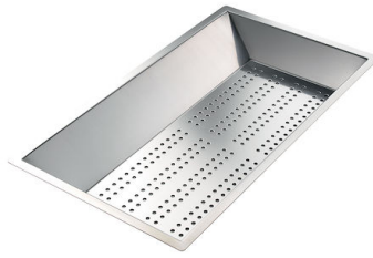
Cuvette perforée en acier inoxydable 8151 000

* uniquement en combinaison avec l'accessoire 8644 101